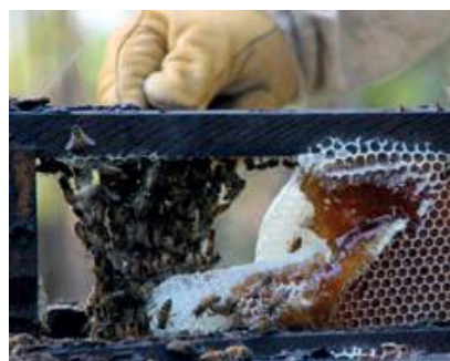
Afb. 4 Inhoud bijenkorf Zuid-Soedan